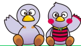
埼玉県マスコット コバトン&さいたまっち