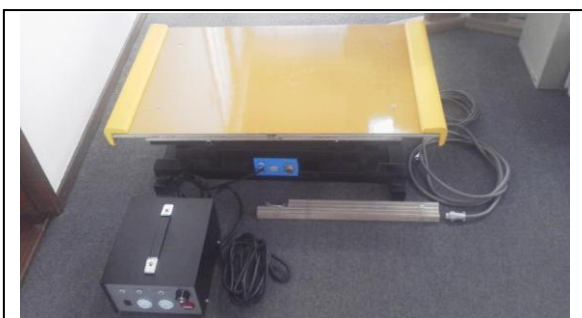
写真 1 (研究用) 姿勢制御の研究 双方向速度可変外乱刺激装置