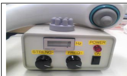
写真 2 (研究用) 機械振動刺激装置 (イリュージョン)